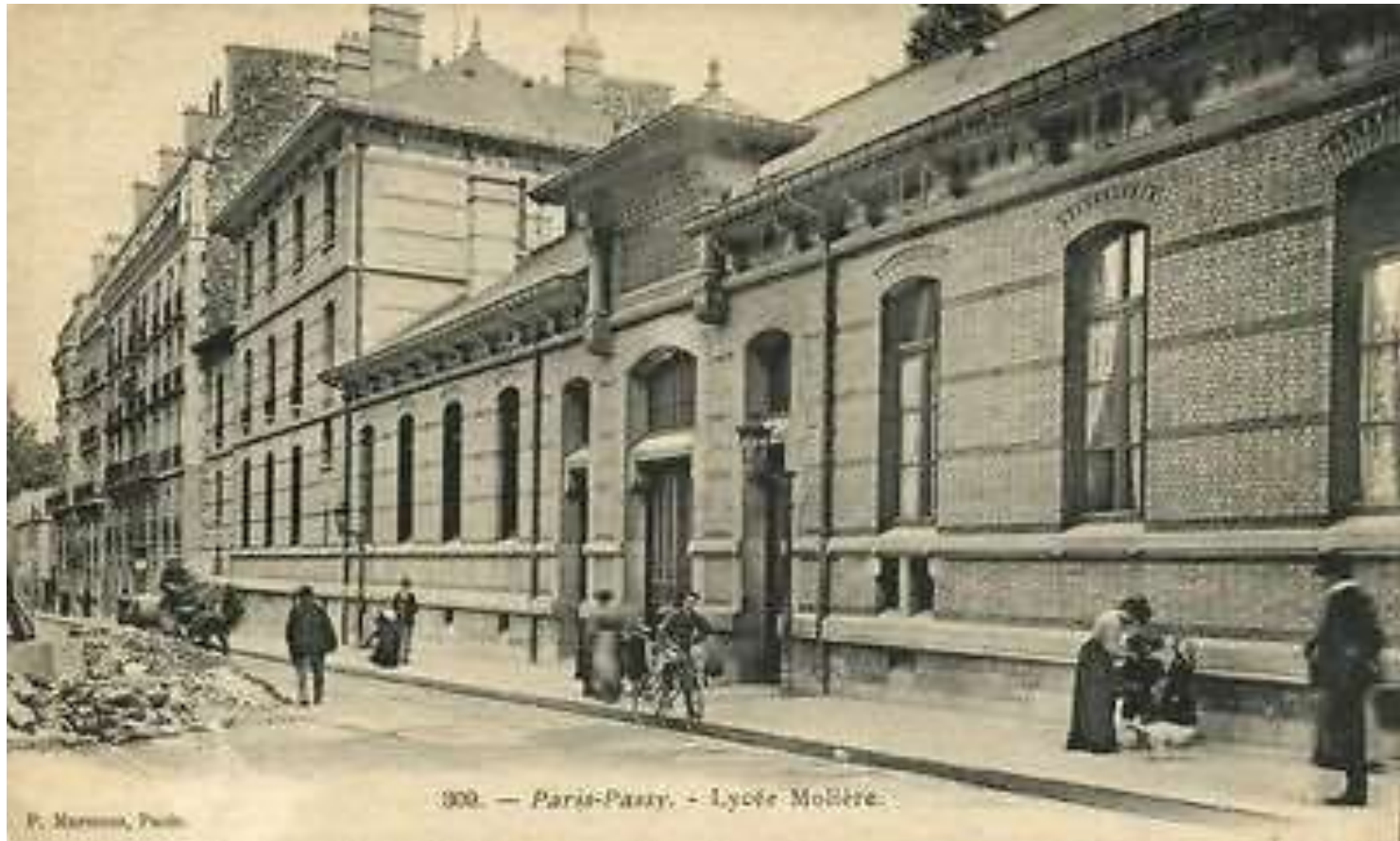
300. — Paris-Passy. - Lycée Molière.