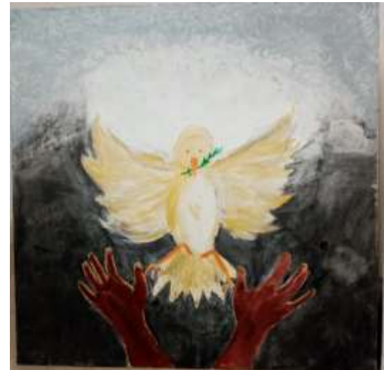
Espoir malgré la Guerre ...