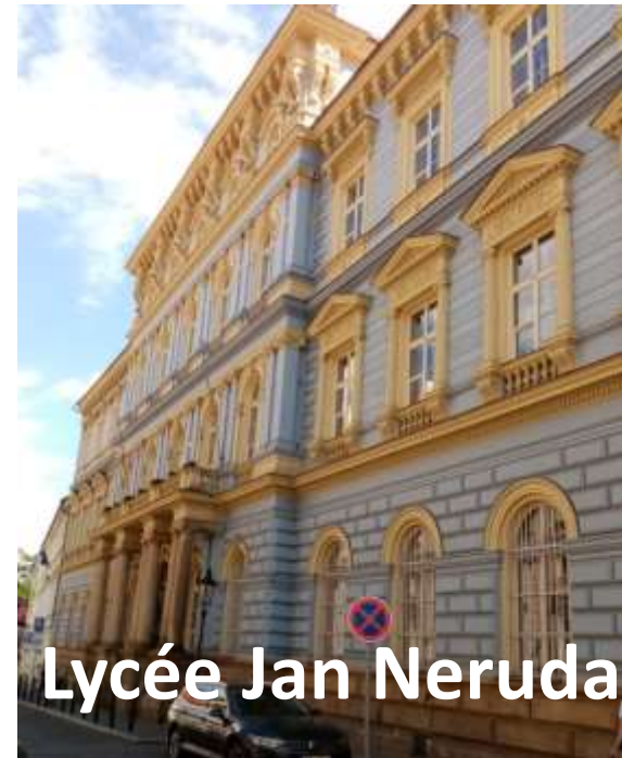
Lycée Jan Neruda

Nouveaux lycées partenaires du Relais de la Mémoire Juniors à Prague (République Tchèque)