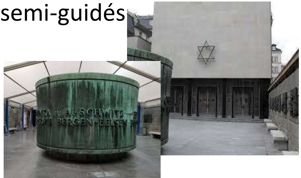
Le fronton et les noms des camps