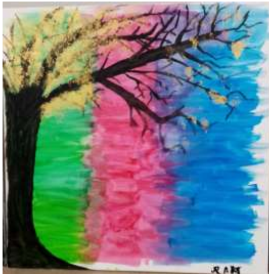
Vivre / Survivre / Revivre