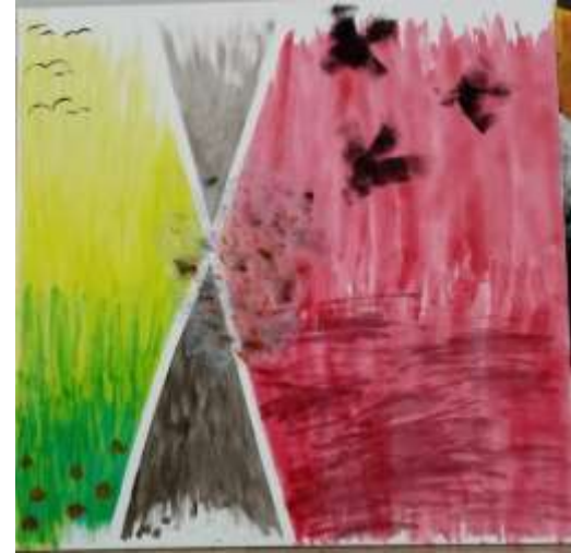
Vivre / Guerre / Survivre