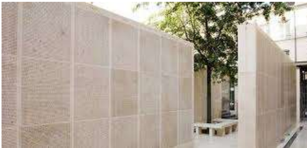
Le « mur des noms des déportés »