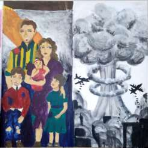
Paix / Guerre