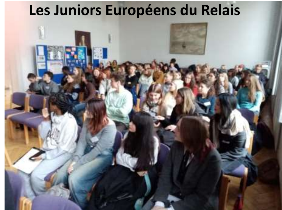
Les Juniors Européens du Relais