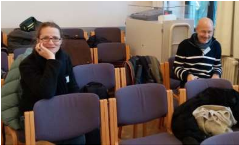
Les adultes accompagnateurs